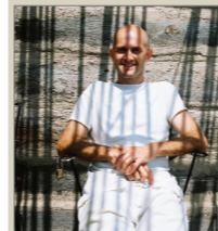
COTE FRAMIS Estudios superiores de Biología sanitaria. Quiro- masagista terapèutic.

972 451 593 | hostal ca l'anton c/ santa clara | www.banysargila.com